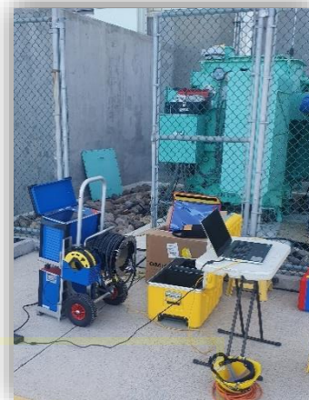
Pruebas eléctricas a transformador de distribución.