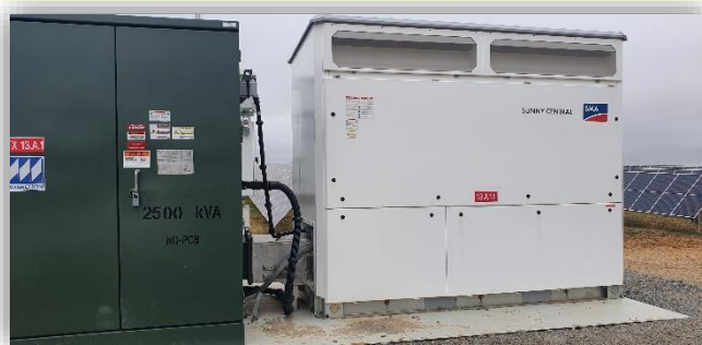
Inspección de garantía y puesta en servicio transformador e inversor de voltaje.