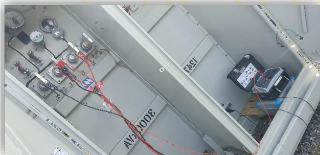
Pruebas eléctricas resistencia de aislamiento a transformador distribución.