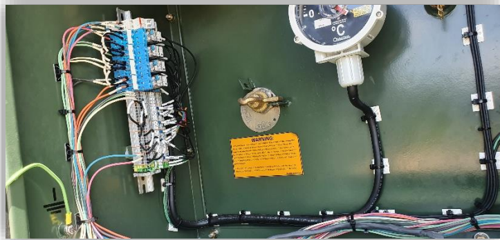
Comisionamiento MVT y pruebas de confiabilidad.