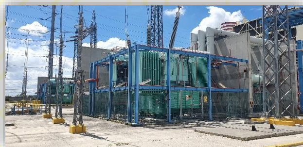
Inspección bus de fase segregada en transformador de potencia.