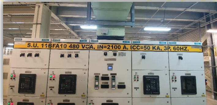
Mantenimiento a tablero interruptores 480VCA