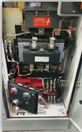
Mantenimiento a arrancador 75HP 480VCA